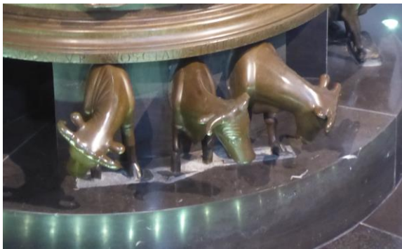
Doopvont in Bartholomeuskerk