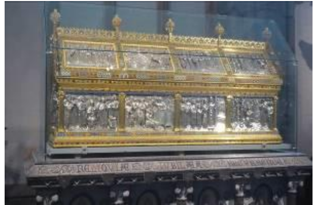
Kathedraal van Luik St Paulus