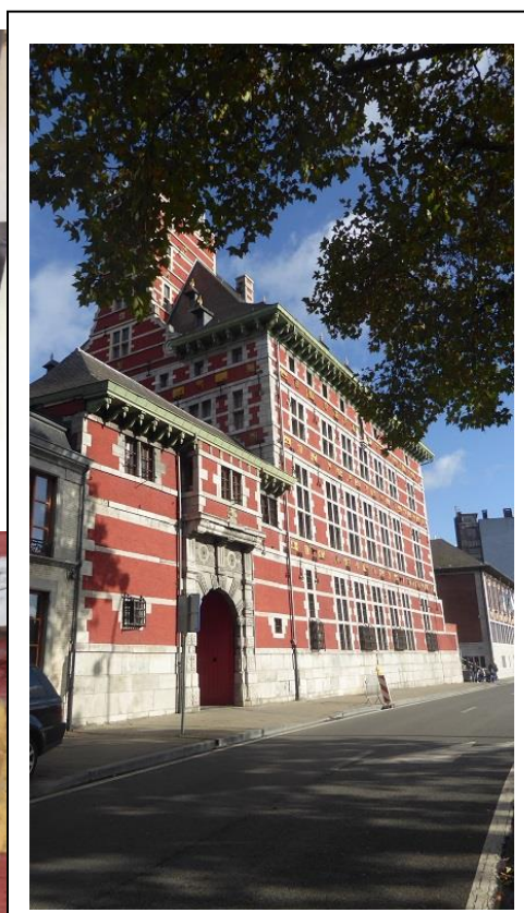
Grand Curtius (2009)