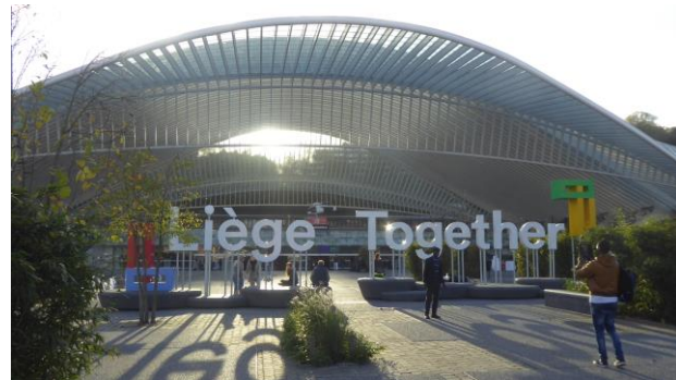
Monument van de gesneuvelden langs de Maas, Palais des Congrès, Passerelle La Belle Liègeoise, 2016, Guillemins station (2009 september)